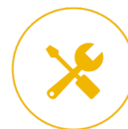
Étude & fabrication

➤ Concept Alu planifie le rendez-vous du métré dès la réunion de lancement afin de vous garantir le délai d'intervention.