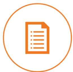
Formalités & gestion administrative

➤ Vous connaissez ainsi le budget global de votre projet.