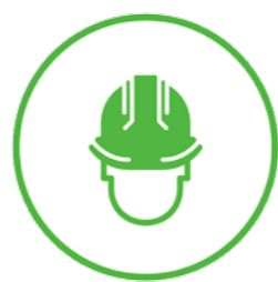
Lancement du chantier

➤ Notre service connaît parfaitement les réglementations spécifiques de chaque commune, il anticipe ainsi les attentes des administrations, ceci facilite l'obtention des permis de construire (près de 1000 dossiers par an).